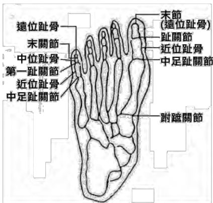
上、下肢關節名稱說明圖

而上述「為維持生命必要之日常生活活動」，係指食物攝取、大小便始末、穿脫衣服、起居、步行、入浴等。