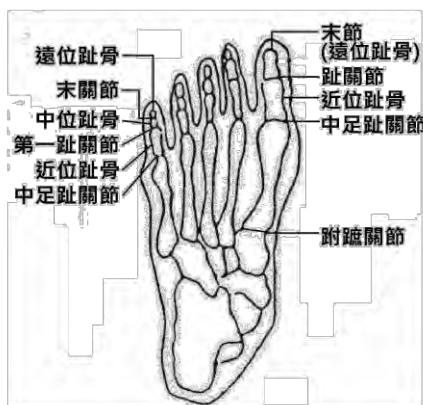
上、下肢關節名稱說明圖

而上述「為維持生命必要之日常生活活動」，係指食物攝取、大小便始末、穿脫衣服、起居、步行、入浴等。