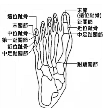
上、下肢關節名稱說明圖

而上述「為維持生命必要之日常生活活動」，係指食物攝取、大小便始末、穿脫衣服、起居、步行、入浴等。