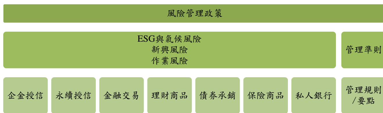
圖一：氣候變遷相關治理政策及管理準則